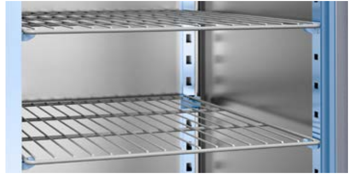
Crémaillères en acier inox AISI 304 à 21 positions - Cremalleras de acero inoxidable AISI 304 de 21 posiciones